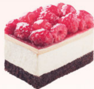
KOSTKA DZIKA MALINA

Delikatny biszkopt przełożony musem truskawkowym oraz warstwą galaretki z truskawkami.