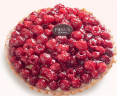
TARTA Z MALINAMI

Tarta na kruchym cieście z delikatnym kremem budyniowym o smaku waniliowym ze świeżymi borówkami. Produkt sezonowy (wiosna/lato)