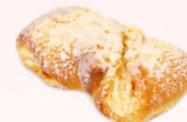
DROŹDŻÓWKA Z SEREM

Ciastko drożdżowe z marmoladą wieloowocową, oblane lukrem.