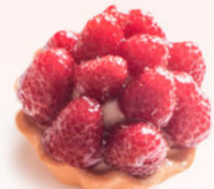
BABECZKA BUDYNIOWA Z MALINĄ

Babeczka z ciasta kruchego wypełniona kremem budyńowym o smaku waniliowym z świeżymi borówkami. Produkt sezonowy (lato)