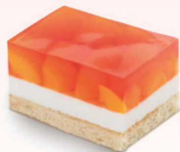
KOSTKA Z BRZOSKWINIAMI

Biszkopt z warstwą puszystej śmietanki, udekorowany galaretką z kawałkami brzoskwini.