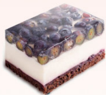
SERNIK Z BORÓWKĄ

Puszysty sernik z dodatkiem wiśni przykryty beżą i kruszonką, posypany cukrem pudrem.