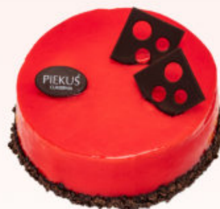
TORT PRALINOWA MALINA

Tort na bazie czekoladowego biszkoptu z chrupiącą, mleczną prżynką, musu z białej czekolady z konfiturą malinową.