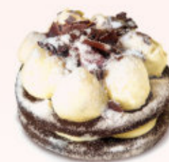
MINI LA BELLA

Babeczka z ciasta kruchego wypełniona kremem budyńowym o smaku waniliowym z świeżymi malinami. Produkt sezonowy