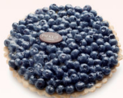
TARTA Z BORÓWKĄ

Tarta na kruchym cieście z delikatnym kremem budyniowym o smaku waniliowym ze świeżymi borówkami. Produkt sezonowy (wiosna/lato)