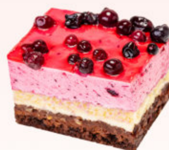
KOSTKA Z PORZECZKĄ

Biszkopt czekoladowy przełożony warstwą nadzienia o smaku słonego karmelu i kremem chantilly. Kostka udekorowana prażonymi orzechami arachidowymi.