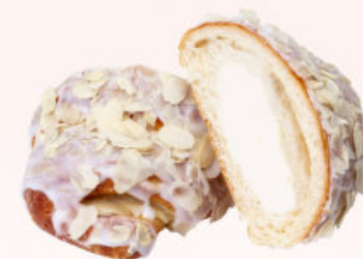
ROGALIK Z SERKIEM

Rogal z ciasta półfrancuskiego z nadzieniem z białego maku i skórki z pomarańczy z migdałami, oblane lukrem, posypany orzechami arachidowymi i skórką pomarańczową. Produkt sezonowy