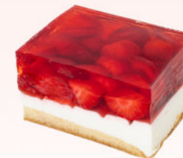
KOSTKA OWCOWA Z TRUSKAWKĄ

Biszkopt czekoladowy przełożony warstwą kremu brulee oraz konfiturą z owoców leśnych, udekorowany musem owocowym z porzeczek, truskawki oraz malin. Produkt sezonowy (wiosna/lato)