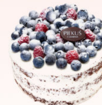
TORT LEŚNY CHRUŚNIAK

Delikatna beza przełożona delikatnym musem na bazie serka mascarpone, przełamana konfiturą z malin.