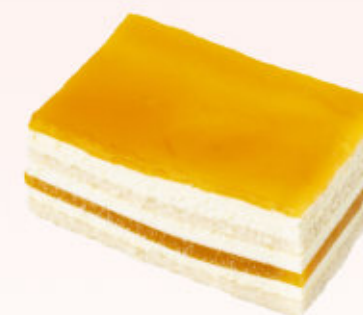
KOSTKA MANGO MARAKUJA

Biskopt czekoladowy nasączony ponczem, przełożony kremem czekoladowym z dodatkiem alkoholu.