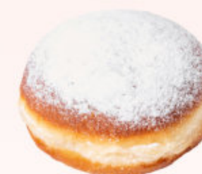
PĄCZEK O SMAKU RÓŻANYM

Ciasto drożdżowe z nadzieniem toffi/konfiturą malinową oblane lukrem.