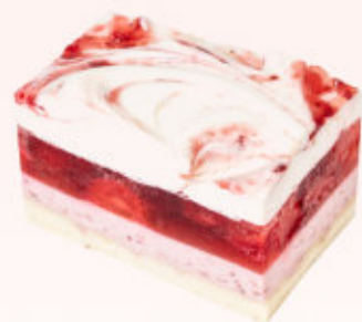
KOSTKA TRUSKAWKOWY RAJ

Delikatny biszkopt przełożony musem truskawkowym oraz warstwą galaretki z truskawkami.