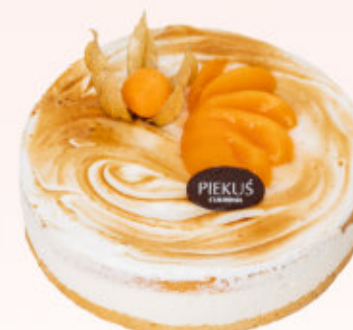
TORT JOGURTOWO - BRZOSKWINIOWY

Torcik z delikatnym kremem na bazie serka mascarpone i śmietanki na biszkopcie nasączonym ponczem kawowym z dodatkiem likieru Amaretto. Produkt sezonowy