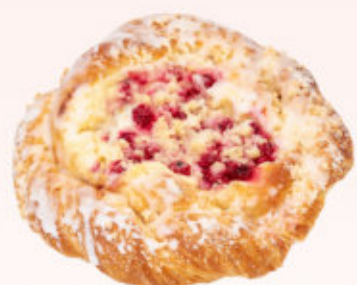
DROŹDŻÓWKA PÓLFRANCUSKA Z SEREM I CZERWONĄ PORZECZKĄ

Ciastko drożdżowe z nadzieniem makovym, posypane kruszonką i oblane lukrem.