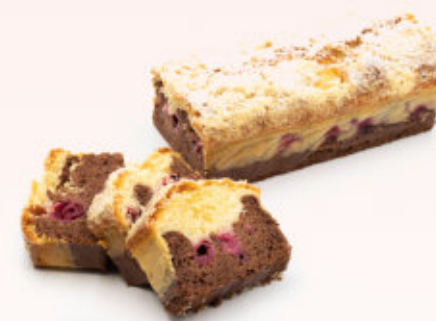
BABKA Z WISIENKĄ I KRUSZONKĄ

Delikatne ciasto biszkoptowe z dodatkiem czekolady w polewie o smaku czekolady deserowej.