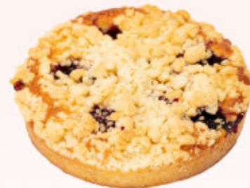
OWOCOWY OGRÓD Z JEŻYNĄ

Delikatne ciastko o intensywnie owocowym smaku z dodatkiem jeżyn, posypane kruszonką.