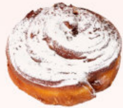
RACUSZEK Z JABŁKIEM

Delikatne ciasto z dodatkiem jabłek prażonych, w kształcie ślimaka, udekorowane cukrem pudrem.