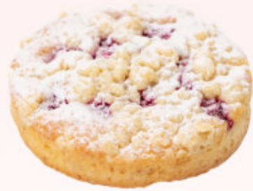
CIASTKO OWOCOWY OGRÓD Z MALINAMI

Delikatne ciastko o intensywnie owocowym smaku z dodatkiem malin posypane kruszonką i cukrem pudrem.