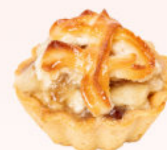
TARTELETKA Z JABŁKIEM

Babeczka na kruchym spodzie wypełniona puszystym kremem budyniowym o smaku waniliowym udekorowana czekoladką i wiśnią kandyzowaną. Produkt okolicznościowy