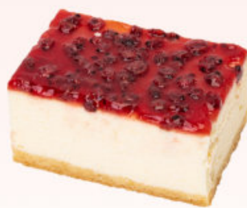
SERNIK DOLCE VITA

Aksamitny sernik na czekoladowym biszkopcie z galaretką i świeżymi borówkami. Produkt sezonowy (lato)