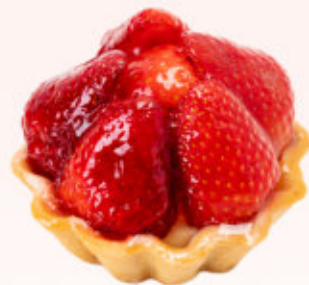
BABECZKA BUDYNIOWA Z TRUSKAWKĄ

Babeczka z ciasta kruchego wypełniona kremem budyńowym o smaku waniliowym z owocami.