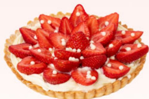
TARTA Z TRUSKAWKAMI

Tarta na kruchym cieście z delikatnym kremem budyniowym o smaku waniliowym ze świeżymi malinami. Produkt sezonowy (wiosna/lato)