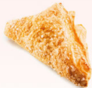
CIASTKO FRANCUSKIE Z JABŁKIEM

Ciastko z ciasta parzonego oblane lukrem.