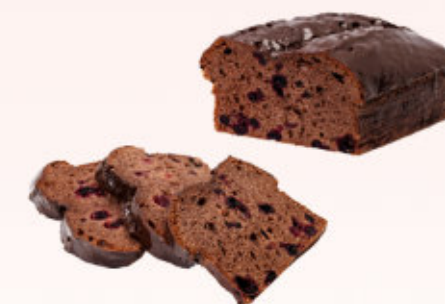
BABKA Z PORZECZKĄ

Puszyste ciasto biszkoptowe o smaku kakaowo-waniliowym z dodatkiem soczystych wiśni, posypane cukrem pudrem.