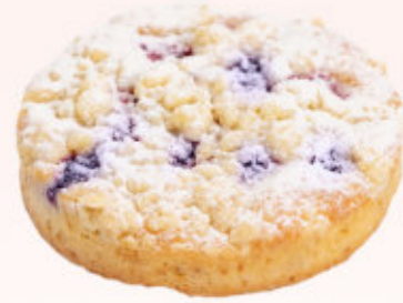
CIASTKO OWOCOWY OGRÓD Z PORZECZKĄ

Delikatne ciastko o intensywnie owocowym smaku z dodatkiem malin posypane kruszonką i cukrem pudrem.