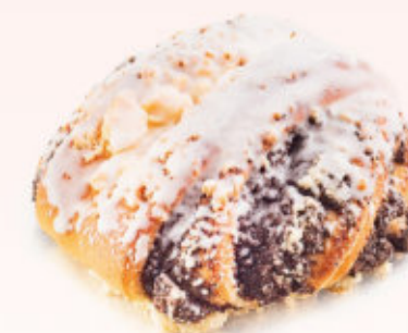
DROŹDŻÓWKA Z MAKIEM

Ciastko drożdżowe posypane kruszonką i oblane lukrem.