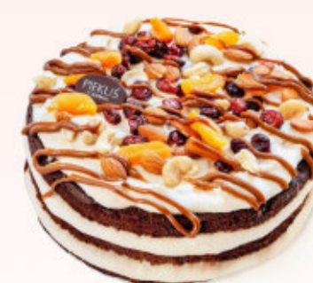
TORT BAKALIOWY CHRUŚNIAK

Mieszanka delikatnego kremu z dodatkiem wina vermouth i delikatnych bezików.