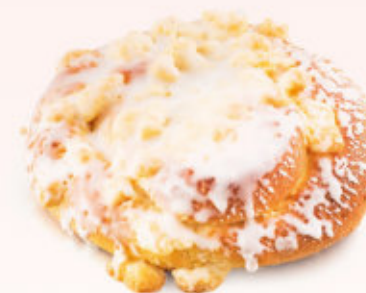
DROŹDŻÓWKA Z KRUSZONKĄ

Drożdżówka z ciasta półfrancuskiego z kawałkami brzoskwini, udekorowana kruszonką i lukrem.