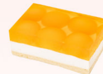
KOSTKA OWOCOWA Z MORELĄ

Biskopt przełożony warstwą galaretki z kawałkami owoców i bakalii oraz kremem waniliowym.