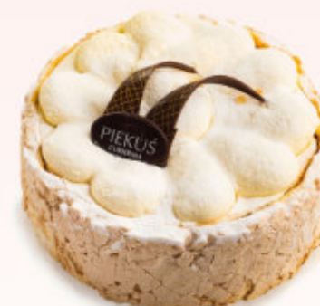
TORT BEZOWA CHMURKA

Śmietanka połączona z musem ze świeżych malin, delikatną migdałową nutą oraz konfiturą owocową.