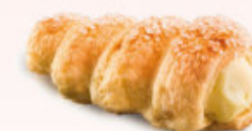
RURKA Z KREMEM

Ciasto parzone z bitą śmietanką i cukrem pudrem. Produkt sezonowy