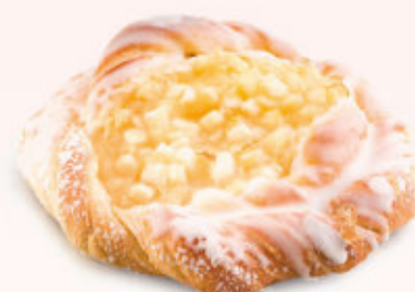
DROŹDŻÓWKA PÓLFRANCUSKA Z JABŁKIEM

Ciastko półfrancuskie z serem i czerwoną porzeczką, posypane kruszonką i oblane lukrem.