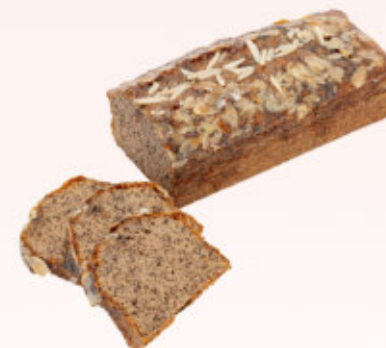
BABKA Z MAKIEM

Puszyste ciasto biszkoptowe o smaku cytrusowym z dodatkiem soczystych mandarynek.