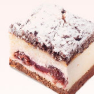
SERNIK Z BEŻĄ I WIŚNIĄ

Puszysty sernik z beżą z dodatkiem soczystych kawałków brzoskwini, udekorowany cukrem pudrem.