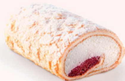
ROLADA BEZOWA Z MALINAMI

Delikatna beza wypełniona kremem śmietankowym oraz konfiturą z malin.