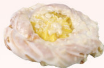
DROŹDŻÓWKA Z BUDYNIEM

Drożdżówka z ciasta półfrancuskiego wypełniona budyniem, udekorowana kruszonką i lukrem.