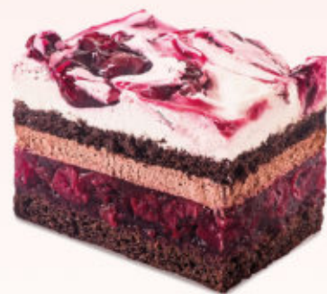
KOSTKA WIŚNIOWY RAJ

Czekoladowy biszkopt przełożony kremem czekoladowo-rumowym z dodatkiem soczystych wiśni w żelu, połączonych z puszystą śmietanką.