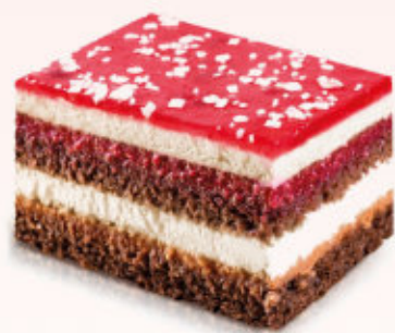
KOSTKA PRALINOWA MALINA

Biszkopt o smaku czekoladowym przełożony musem śmietankowym z dodatkiem białej czekolady, posypana wiórkami czekoladowymi.