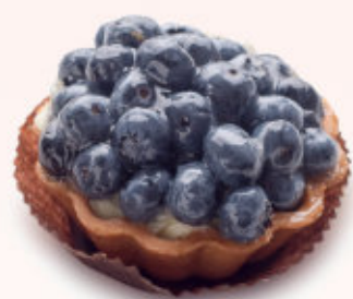
BABECZKA BUDYNIOWA Z BORÓWKĄ

Babeczka na kruchym cieście wypełniona puszystą masą serową z dodatkiem orzechów włoskich i kajmaku.