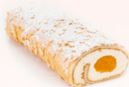
ROLADA BEZOWA MANGO MARAKUJA

Delikatna beza wypełniona kremem śmietankowym oraz konfiturą z malin.