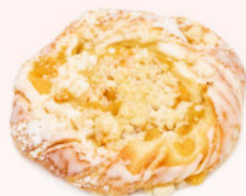
DROŹDŻÓWKA Z MORELĄ

Drożdżówka z ciasta półfrancuskiego wypełniona budyniem, udekorowana kruszonką i lukrem.