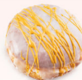
PĄCZEK Z NADZIENIEM TOFFI

Ciasto drożdżowe z nadzieniem toffi/konfiturą malinową oblane lukrem.