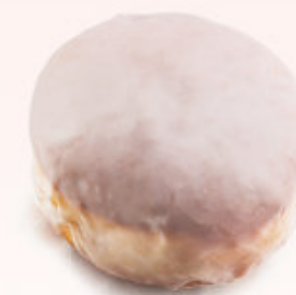
PĄCZEK Z MARMOLADĄ

Rogal z ciasta półfrancuskiego z nadzieniem z białego sera, oblane lukrem i posypany płatkami migdałów.