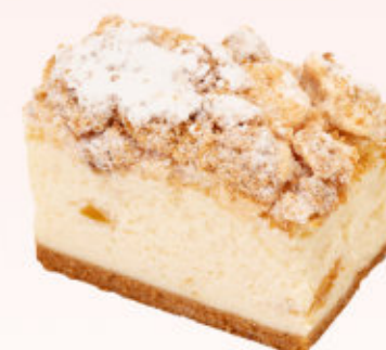
SERNIK Z BRZOSKWINIAMI

Puszysty sernik na kruchym cieście udekorowany lukrem.