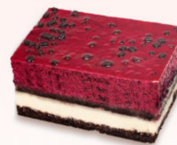
KOSTKA OWOCE LEŚNE

Kostka na czekoladowym biszkopcie przełożona chrupiącą prażynką z dodatkiem orzechów arachidowych, budyniem oraz musem na bazie śmietanki i porzeczek.